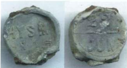
Verzegelloodje van de Hollandsche IJzeren Spoorweg Maatschappij (HYSM) te dateren tussen 1837 en 1938. Op de keerzijde transport datum (22 juni). Coll.: onbekend

Het waarborgzegel (verzegellood) is dus niet voor niets in het leven geroepen, er zal voordien best ooit wel eens iets mis zijn gegaan.