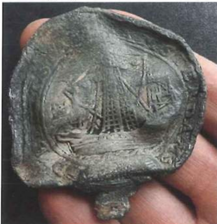
Zeer groot staallood, afkomstig uit Amsterdam, met op de voorzijde een handelsschip aan de kade. Datering: tweede kwart van de 17e eeuw. Collectie: Gosse van der Veen.

ring naar de lakenhal. De keurmeesters bekeken het, verder nog onbewerkte, weefsel nauwkeurig en gaven hun oordeel.