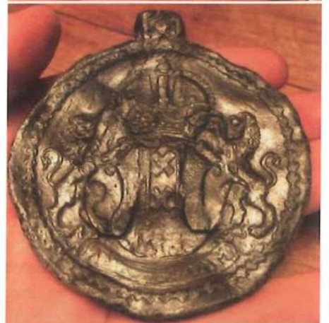
Uitzonderlijk goed leesbaar staallood, van maar liefst 'Drie Staal' (8 cm.), Amsterdam, met op de voorzijde handelsschip op volle zee en op de keerzijde het door twee leeuwen gedragen wapenschild van Amsterdam.