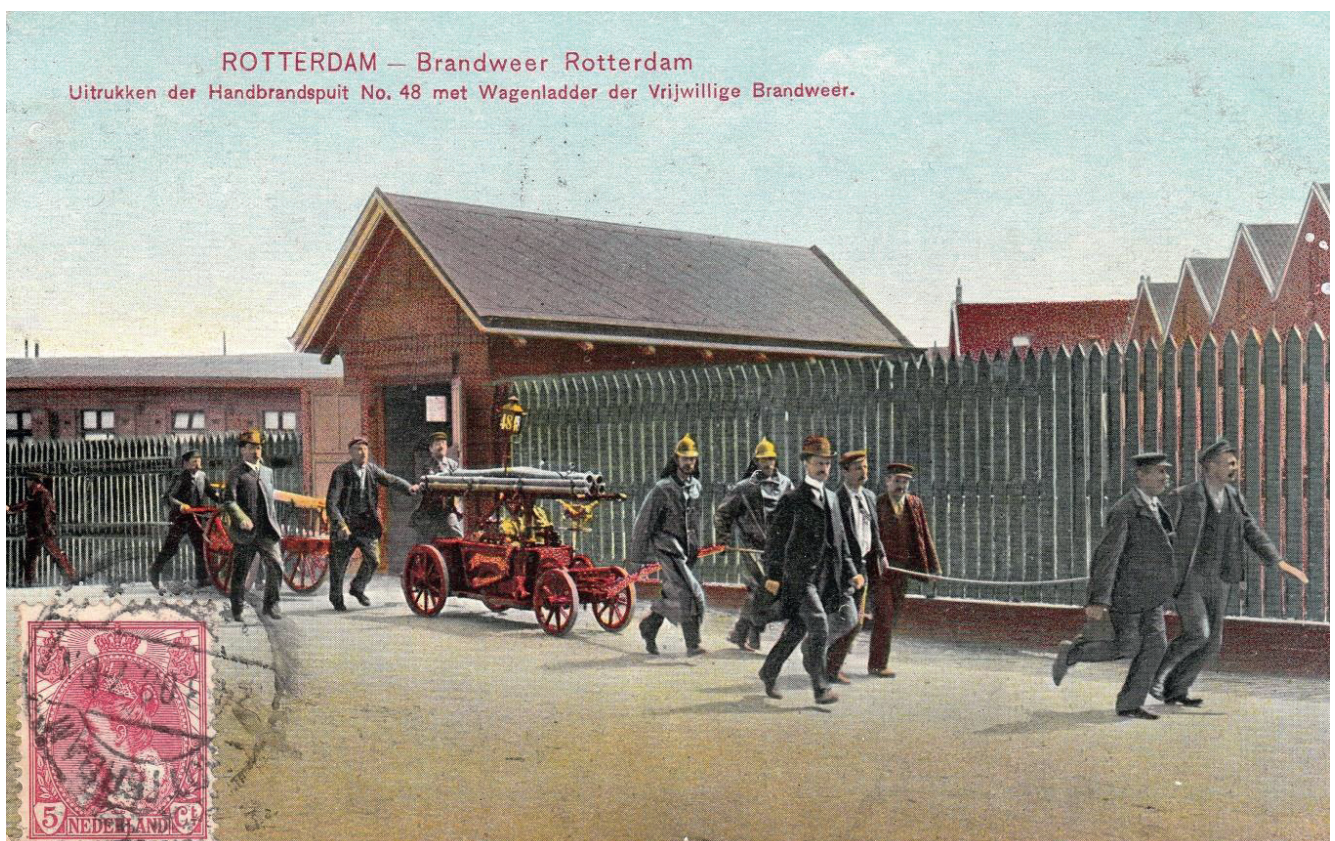
Ook deze Rotterdamse ansicht uit ca 1900 van een uitrukkende brandweer is zeer illustratief

Door de aanvankelijk weinig functionele kleding, de royaal aanwezige onderscheidingstekens en de soms meegevoerde vaandels leek het vaak meer op een feestelijke optocht. De uitrusting der geaffecteerden met uitbundige onderscheidingstekens zoals hoeden met linten, armbanden, kokardes en medailles aan kleurige linten die op de normale kleding werden gedragen gecombineerd met vaandels was meer ceremonieel dan functioneel. Daardoor moeten de uitrukkende spuitgasten met hun brandspuiten en verder materieel zoals lantaarns, ladders en brandzeilen voor de toeschouwers meer weg gehad hebben van een vrolijke optocht dan van een effectief opererend team brandbestrijders. Bier en jenever versterkten dat beeld nog meer.