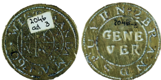
WESTZAANDAM Ao 1760, BRANDSPUYT No 2 GENEVER

Pas in de 19 e eeuw vond de geleidelijke omslag plaats naar meer functionele, vooral beschermende kleding tegen vuur, hitte, vallend puin en water.