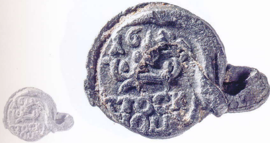
1859. Vz. [ 250% ]