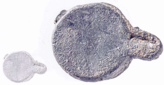
1859. Kz. [ 250% ]