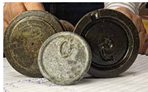
De twee gietmallen voor loden penning C met in het midden het product. De gietvormen hebben een houten handvat waarmee ze tegen elkaar werden gedrukt bij het gieten. De gietopening op de rechtermal is goed zichtbaar. Later wordt het persoonsnummer er in geslagen. Collectie Gemeente Enkhuizen, foto auteur in 2007.

De gemeente Enkhuizen is als eigenaar van de museumcollectie in het gelukkige bezit van de set ijzeren mallen, voor alle vier de spuiten, om deze loden penningen mee te gieten.