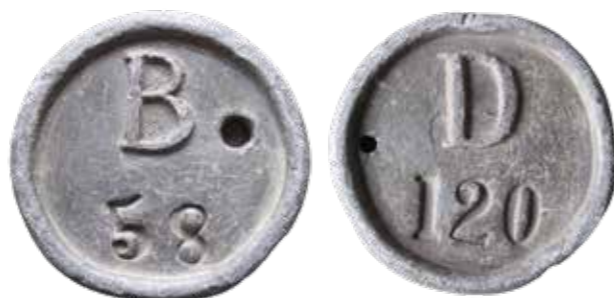
Type Enkh4 Loden penningen met de letters B en D, 49 mm. Collectie auteur.

spuit waarbij ze waren ingedeeld en een nummer. Bij appèl moesten ze die inleveren en kregen ze terug als de dienst was afgelopen. Deze organisatie kwam te vervallen, toen in 1905 de motorspuiten werden ingevoerd' Dit lijkt over dezelfde penningen te gaan. De penningen met functieaanduidingen, die van 1801 tot 1840 in gebruik zijn geweest, zijn waarschijnlijk buiten gebruik gesteld. In plaats daarvan komt nu de serie loden penningen. Deze zijn eenzijdig en hebben alleen een (spuit)letter en een persoons-, tevens functienummer. Nuijttens 4 beeldt er twee af op pagina 33 in zijn catalogus zonder juiste toeschrijving, hij denkt zonder reden dat ze van Breda en Diemen zouden kunnen zijn. Ze zijn dus van Enkhuizen.