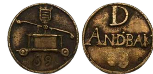
Type Enkh2 Spuit D, spuitgast 89. Fries Museum: N14171