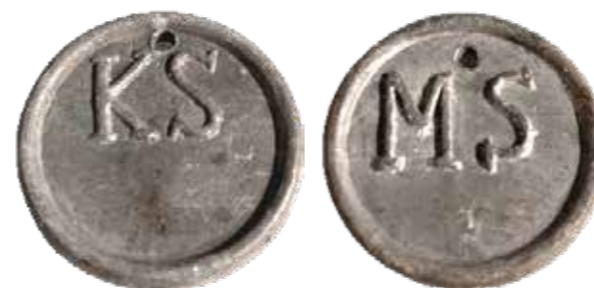
Type Enkh5a en Enkh5b Loden penningen met de letters KS en MS, eenzijdig 49 mm.

Er blijken zelfs twee typen loden penningen aanwezig te zijn: behalve het type met de letters A, B, C of D gevolgd door een ingeslagen nummer komen er ook eenzijdige penningen voor met de letters KS en MS, al dan niet gevolgd door een cijfer. Na de afschaffing van de Schutterij in 1905 richt de Brandraad een korps Kringsluiters op. Een instructie voor de Kwartiermeesters van de Kringsluiters, de Assistent Kwartiermeesters en de Kringsluiters wordt