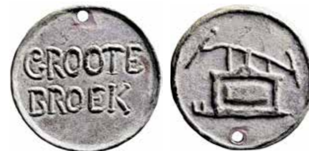
Type Groo1 Nationale Numismatische Collectie: GP-00230

De spuitletter staat onder de spuit, op de andere kant het persoonsnummer boven de functie. De volgende twee functies zijn bekend: AANDE / BAK en AAN / VOERDER. 'Aan de bak' heeft betrekking op de 'bak' van de perspomp, de functie was dus pomper. Ze doen sterk denken aan de stukken uit Grootebroek en Lutjebroek, die echter geen spuit- of persoonsaanduiding hebben.