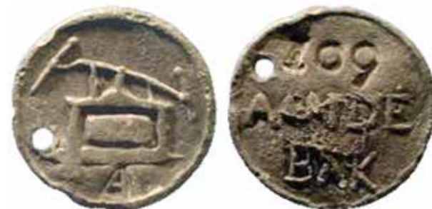
Type Enkh1 Bodemvondst Jan den Das

De spuitgasten beschikten al kort na de instelling van de brandraad over brandspuitpenningen. Deze hadden een tweeledig doel. Tijdens een brand of oefening moesten de penningen worden ingeleverd waardoor de aanwezigheid bekend was en voor de spuitgast was de (legitimatie) penning het bewijs aan anderen dat hij het Brandwezen diende. Besloten werd verder dat de brandmeesters en commandeurs beschikten over kaartjes die gegeven werden aan spuitgasten die hun penning hadden vergeten. Van Enkhuizen bestaan primitief ogende loden penningen. Waarschijnlijk zijn dit de oudste penningen, dus uit de periode van voor 1800.