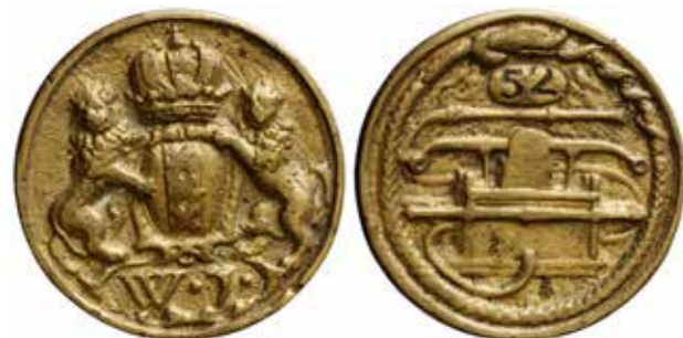
Type Amst1a Amsterdam Wijk 7 spuitgast 52. Amsterdam Museum PA 322

De meest voorkomende brandspuitpenning is die van Amsterdam. Op dit moment (januari 2025) zijn er 465 exemplaren als type Amst1 opgenomen in een database die wij bijhouden. De voorzijde vertoont het gekroonde wapenschild van Amsterdam gehouden door twee leeuwen waaronder de letter W(jijk), de wijknummers 1 t/m 60 komen voor, met uitzondering van wijk 48 die geen brandspuit had. Op de keerzijde is een brandspuit afgebeeld waarboven een cartouche met daaromheen een slang die zichzelf in de staart bijt, een slangenrond of ouroboros. Er komen echter ook ander opschriften voor.