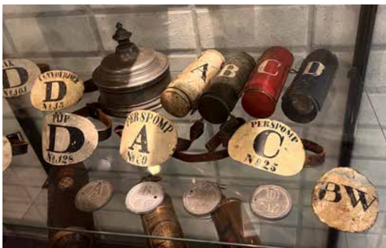
Penningen, armbanden en busjes in de vitrine van de brandweerkazerne van Enkhuizen.

In 1840 verschijnt er een nieuw reglement voor het brandwezen in Enkhuizen. Volgens het hoofdstuk Onderscheidingstekens krijgen de manschappen nu 'een schild en een penning met de letter hunner spuit, de afdeling en het nummer aanwijzende het werk door hen te verrigten.'