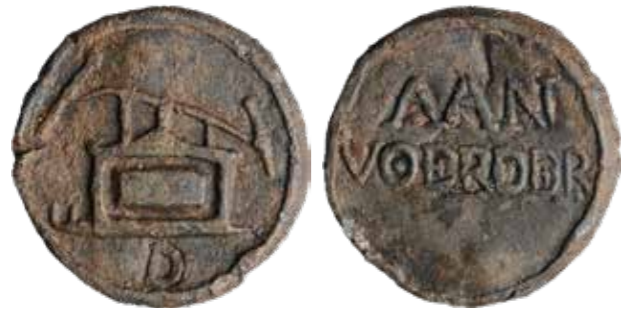
Type Enkh1 Archeologie West-Friesland 553-55-M01

De meest recente vondst, die mij bekend is, is op 3 december 2024 gedaan in de Paulus Potterstraat te Enkhuizen toen de straat daar was open gebroken omdat de riolering vervangen moest worden.