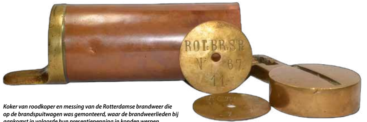
Koker van roodkoper en messing van de Rotterdamse brandweer die op de brandspuitwagen was gemonteerd, waar de brandweelieden bij aankomst in volgorde hun presentiepenning in konden werpen. Collectie Laurens Schulman.

Het doel van deze penningen was tweeledig: in de eerste plaats als penning om zich te legitimeren bij de schutterij/burgerwacht of kringsluiters. Dit waren personen welke een cirkel vormden rond de brand om nieuwsgierigen en plundersaars op een veilige afstand te houden, en in de