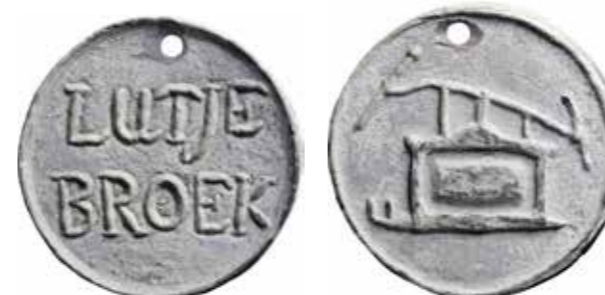
Type Lutj1 Nationale Numismatische Collectie: GP-00267

Voor de werving van manschappen wordt Enkhuizen op 29 augustus 1801 opnieuw ingedeeld. In oktober van dat jaar worden door de brandmeesters nieuwe penningen aan de spuitgasten uitgereikt.