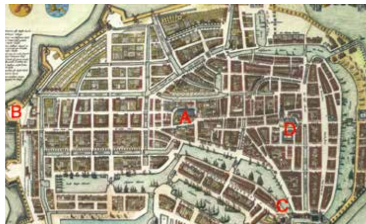
Kaart van Enkhuizen van Blaeu 1652 met daarin ingetekend de vier genoemde plaatsen.

In 1795 is een grote reorganisatie noodzakelijk volgens het gemeentebestuur. Op 6 februari 1796 leidt dit tot 'een ordonnantie op het stuk van de brand binnen de stad Enkhuizen'. Op 7 maart 1796 besluit de gemeenteraad om de brandweer te reorganiseren. Onderdeel daarvan is de instelling van een Brandraad. Met de eerste vergadering van de Brandraad op 16 april 1796 vindt deze reorganisatie zijn beslag. Dit wordt in Enkhuizen nog altijd beschouwd als de start van de brandweer aldaar. Op 30 september 1796 wordt er een 'Reglement wegens de brandspuiten en Brandweer-wezen binnen de stad Enkhuizen' vastgesteld. Er blijken op dat moment vier spuiten in de stad te zijn, aangegeven met de letters A in de Westertoren, B op de Boereboom, een sluis aan de westzijde in de stadswal, C bij de Drommedaris en D bij de Zuidertoren.