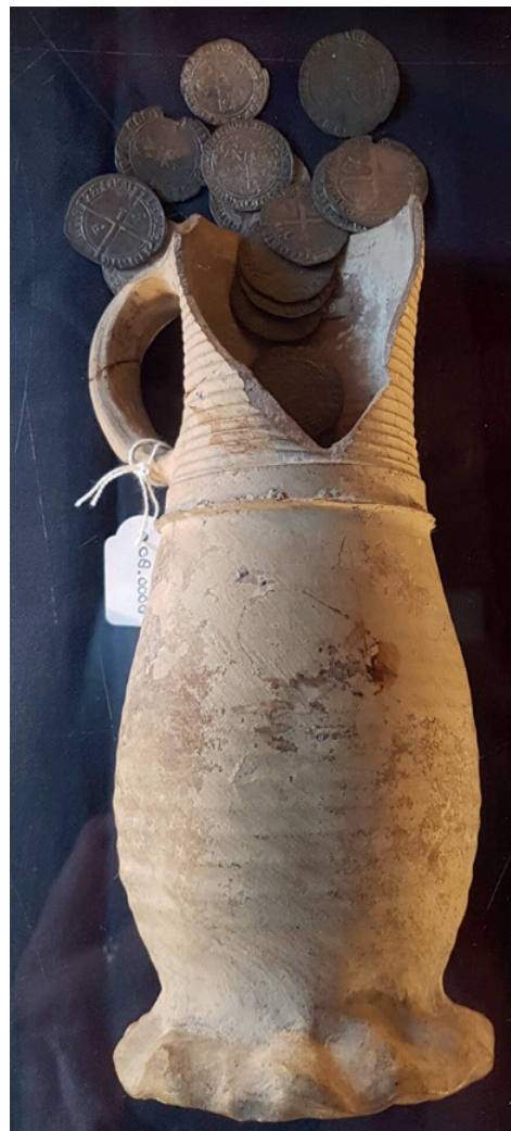
Jacoba kannetje.

De zilverschat lijkt daarmee het kapitaal van een Zuidelijke Nederlander, mogelijk onder de vloer verborgen tijdens zijn verblijf in wat nu de Corneliahoeve is. Aangezien het heetst van de strijd toen al voorbij was, lijkt het eerder een handelaar dan een militair.